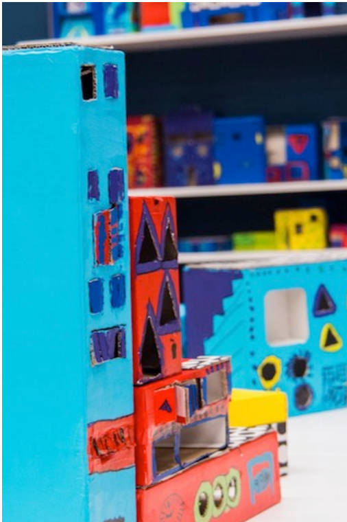
Eine Mitmach-Station, wo Kinder eine eigene Stadt bauen können.