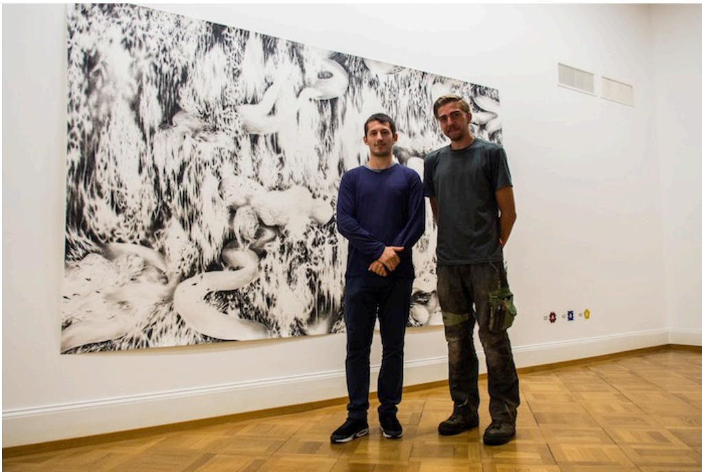
Das Bild im Hintergrund ist das einzige, welches bei allen fünf Geschichten vorkommt. Bei der Story von Rinia stellt es einen Wendepunkt der Handlung dar.