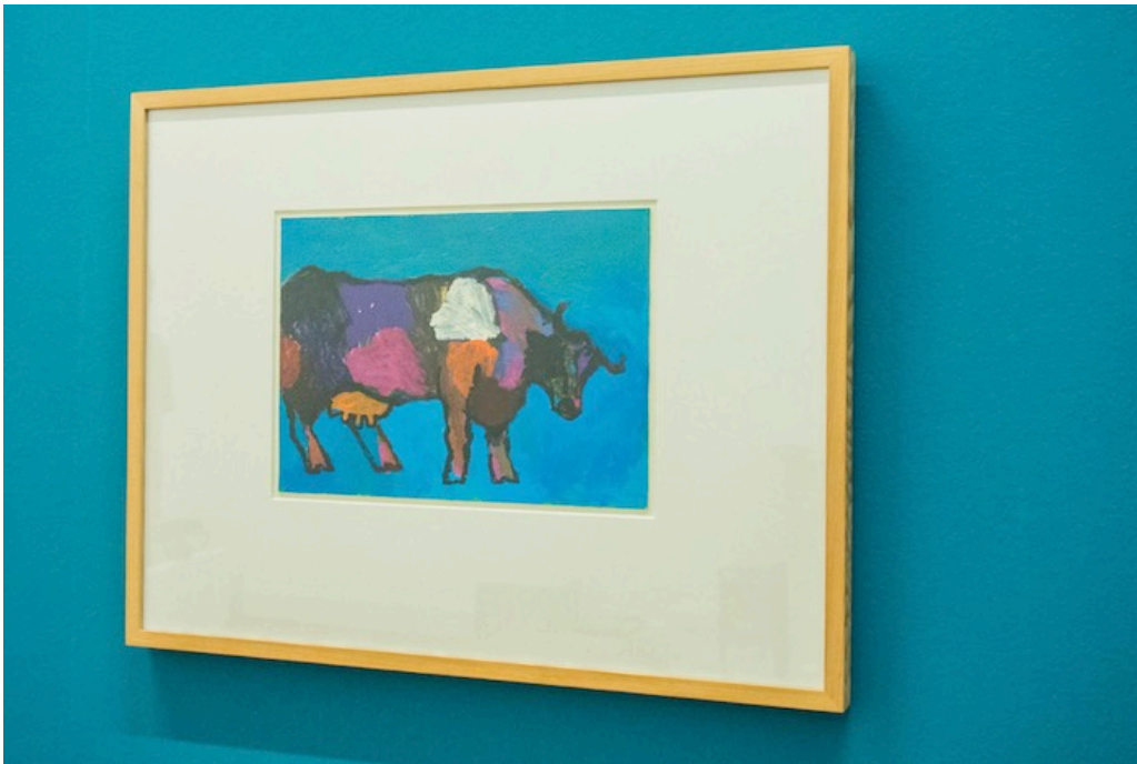
Alles beginnt bei dieser Kuh. Die fünf Spuren der Herbstausstellung des Kunstmuseum Thun starten bei diesem Bild von Bendicht Friedli.