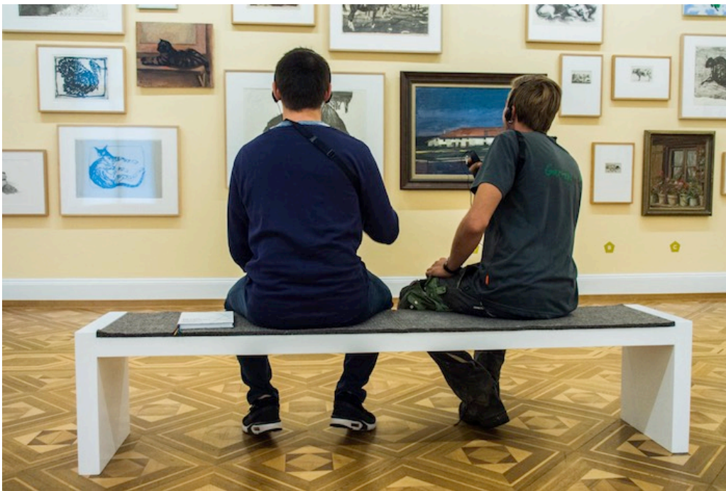
Die Geschichten wurden von den Autoren auf einen Audioguide gesprochen. Shala und Anderegg hören erstmals die Aufnahmen.